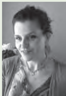
A CURA DI MIRIA BARBONI

PIÙ CONOSCIAMO I DESIDERI ED I BISOGNI REALI E PIÙ PROFONDI DELLA PERSONA CHE ABBIAMO DI FRONTE, PIÙ POTREMO ESSERLE DI VERO AIUTO E FARLE PERCEPIRE DI AVER RICEVUTO UNA CONSULENZA AD ALTISSIMO VALORE .