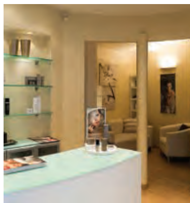
MYOSOTIS COSMETIC POINT CHIARAVALLE - AN