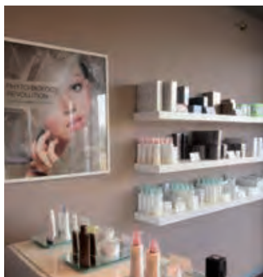
PEVONIA POINT CASALBUTTANO - CR